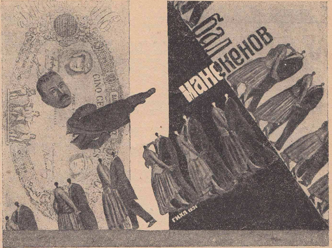
Обложка худ. Н. Седельникова

Графическая часть Государственного издательства художественной литературы